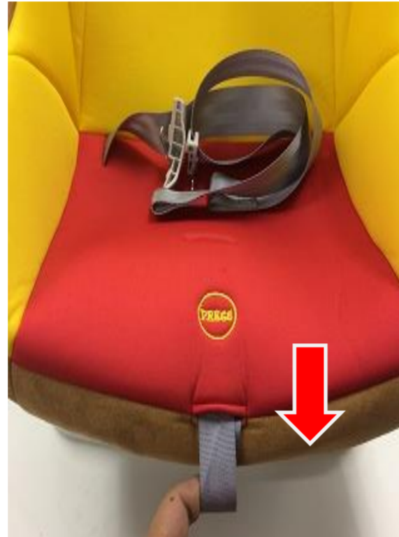
6:肩ベルトストラップをカバーの間から引き出します。