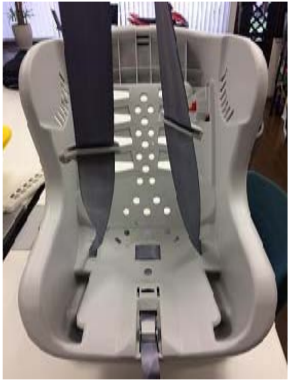
1:肩ベルト/腰ベルトを左右均等にします。