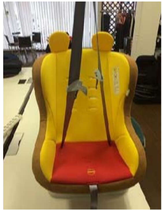
5:カバーをかけたら肩ベルトを引き出します。(ベルトは左右均等にすること。)