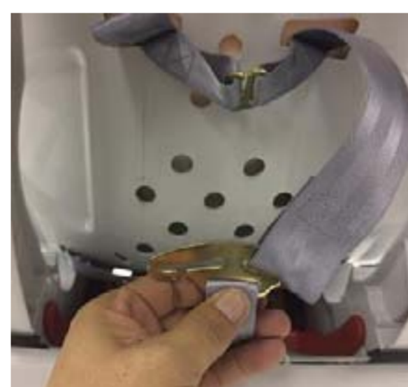
12:肩ベルトをベルト連結金具に左右取り付けます。(肩ベルトの作動確認をしてください) ※ねじれがないようにしてから、取り付けてください。