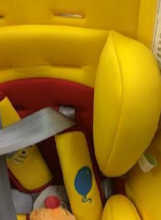
10:インナーパットにシートベルトを入れ、左右の位置を合わせ肩ベルトと肩パットストッパーを入れます