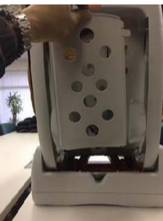
13:バックカバーを取り付けます。 (上2箇所、下側2箇所)