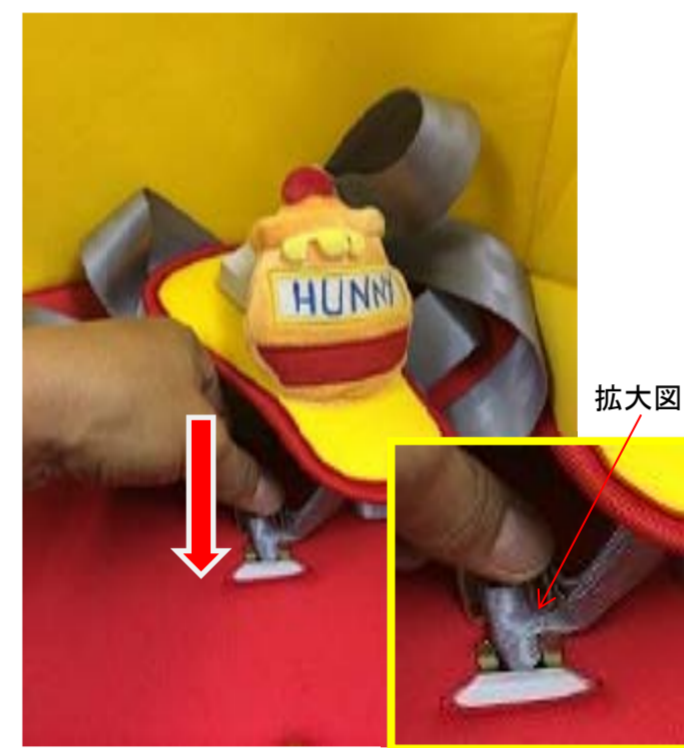
7:バックル取り付け金具を座面中央付近に押し込みます。 ※方向注意