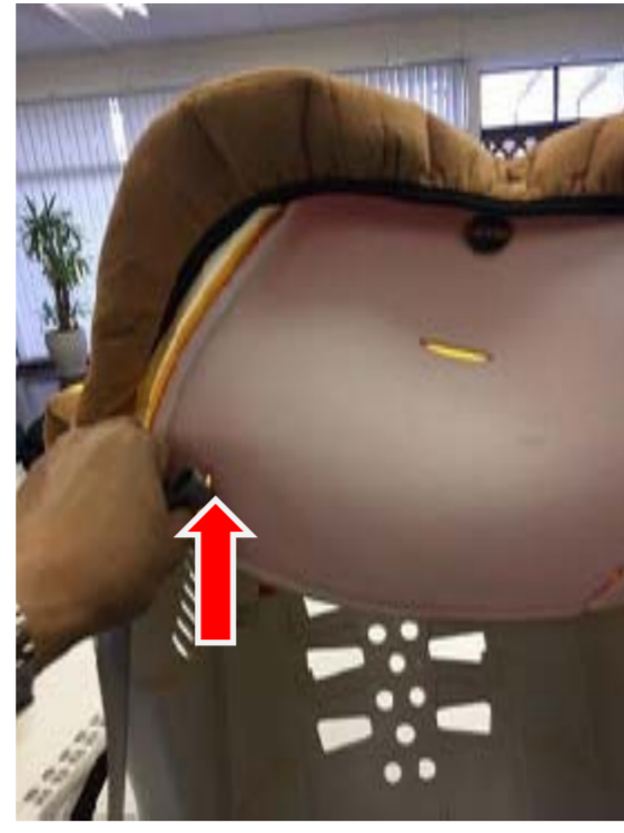
2:カバーに肩ベルトの先端を差し込みます。(左右)