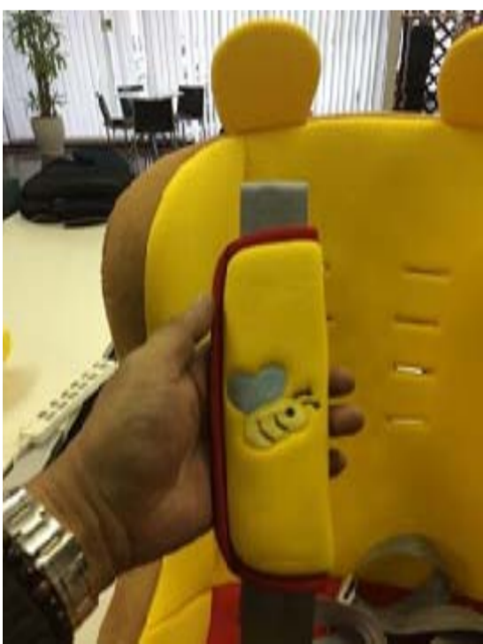
9:肩パットの下から肩ベルトを入れ上に引き出します。