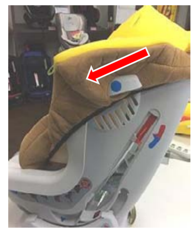
4:左右のベルト通しフックにカバーを通します。