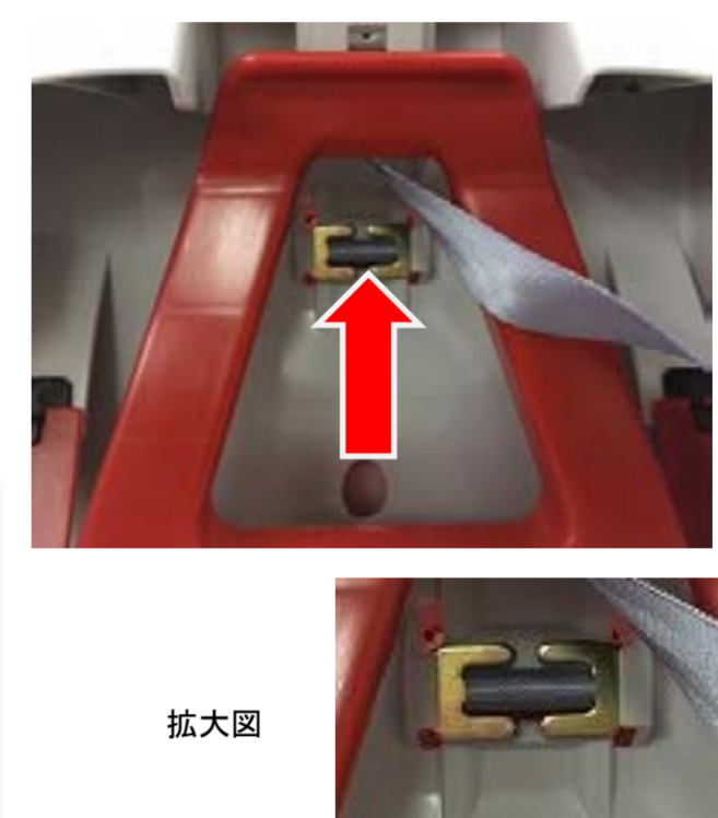
8:リクライニングレバーを押し、手前に本体をリクライニングし、座面の裏側手前に押し込んだバックル取り付け金具を引き出し金具を差し込みます。