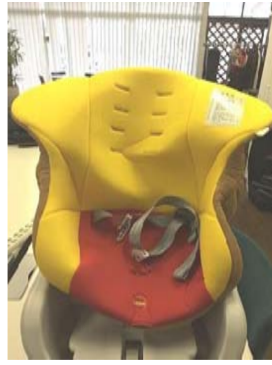
3:上からカバーをかけていきます。