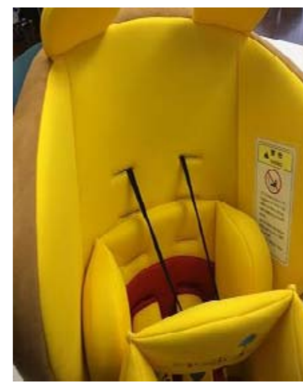
14:ヘッド用インナーパットを取り付けます。